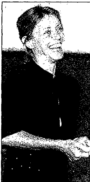
A destra, Alessandro Preziosi e, a sinistra, l'attrice Margherita Buy